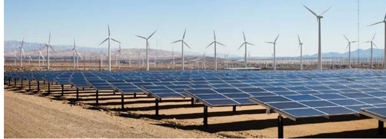
Fig. 1 El clima severo puede causar inundaciones, deslizamientos de tierra y otras amenazas a la infraestructura del sistema de energía y puede afectar la disponibilidad de recursos energéticos. La generación de energía renovable puede mejorar la resiliencia debido a su naturaleza modular y la falta de requisitos de combustible. 5

A través de la planificación holística de la resiliencia, los actores pueden anticiparse, prepararse y adaptarse a las amenazas y tensiones en el sistema eléctrico. La planificación de la resiliencia identifica las amenazas, los impactos y las vulnerabilidades del sistema de energía, y elabora estrategias para mitigarlos.